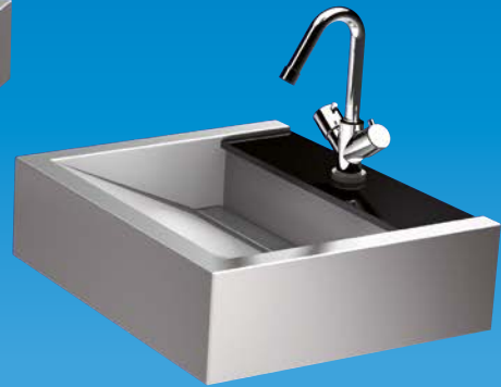
Servant FR 410 02 med dekorskive av svart sten.