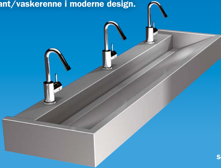
Vaskerenne FR 411 01.